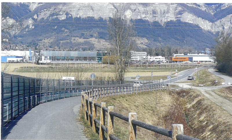
La nouvelle sortie à Bernin a fluidifié la circulation de l'entrée de Crolles

Ce passage à niveau est aujourd'hui l'un des plus préoccupants de la région. Des études